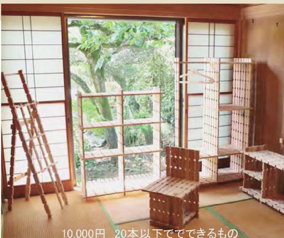
10,000円 20本以下ですることができるもの

一つひとつの材料は細く、弱くても、 組手を幾重にも組むことにより、 靱やかに強くなる。