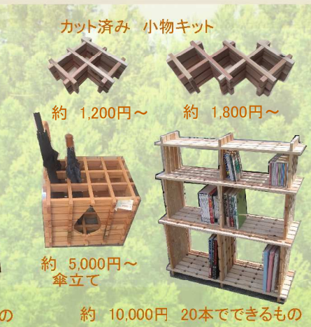
カット済み 小物キット