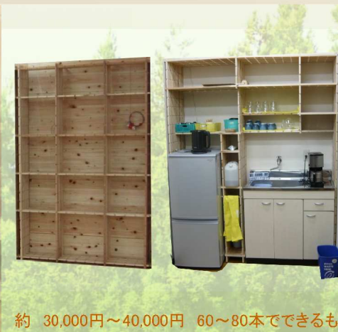
約 30,000円～40,000円 60～80本ですることができるもの